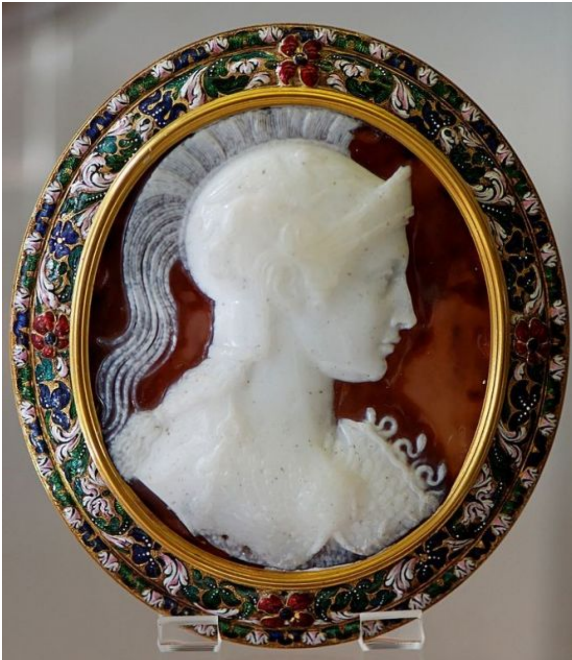
Рис.10. Илл. Афина с эгидой. Камень из сардоникса — конец I в. до н. э. Оправа (золото, эмаль) — конец XVII в. Франция, Париж. Музей медалей и монет