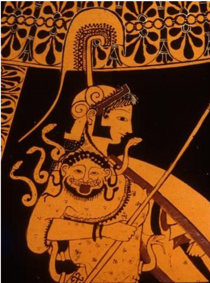
Рис. 14. Афина в сцене «Геракл и Аполлон в борьбе за треножник» (сторона А). Аттическая краснофигурная амфора из Вульчи (Этрурия) мастера Андокида. Ок. 525 г. до н. э. ФРГ, Берлин. Музей античности

33 Змеи, завязанные узлом, на воротнике-эгиде: