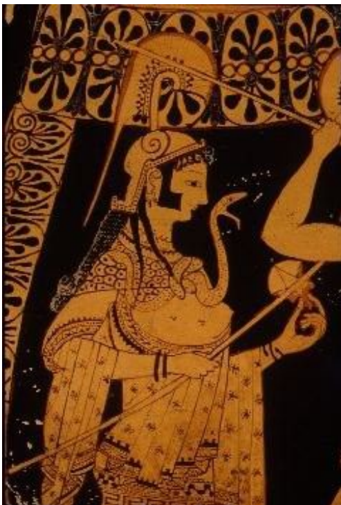
Рис. 15. Афина и Гермес, наблюдающие за борьбой (сторона А). Аттическая краснофигурная амфора из Вульчи мастера Андокида. 525—520 гг. до н. э. Франция, Париж. Лувр