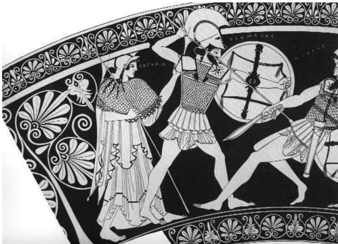
Рис. 6. Афина и Диомед. Краснофигурный кратер из Канио. Ок. 490—480 гг. до н. э. США, Бостон. Музей изящных искусств