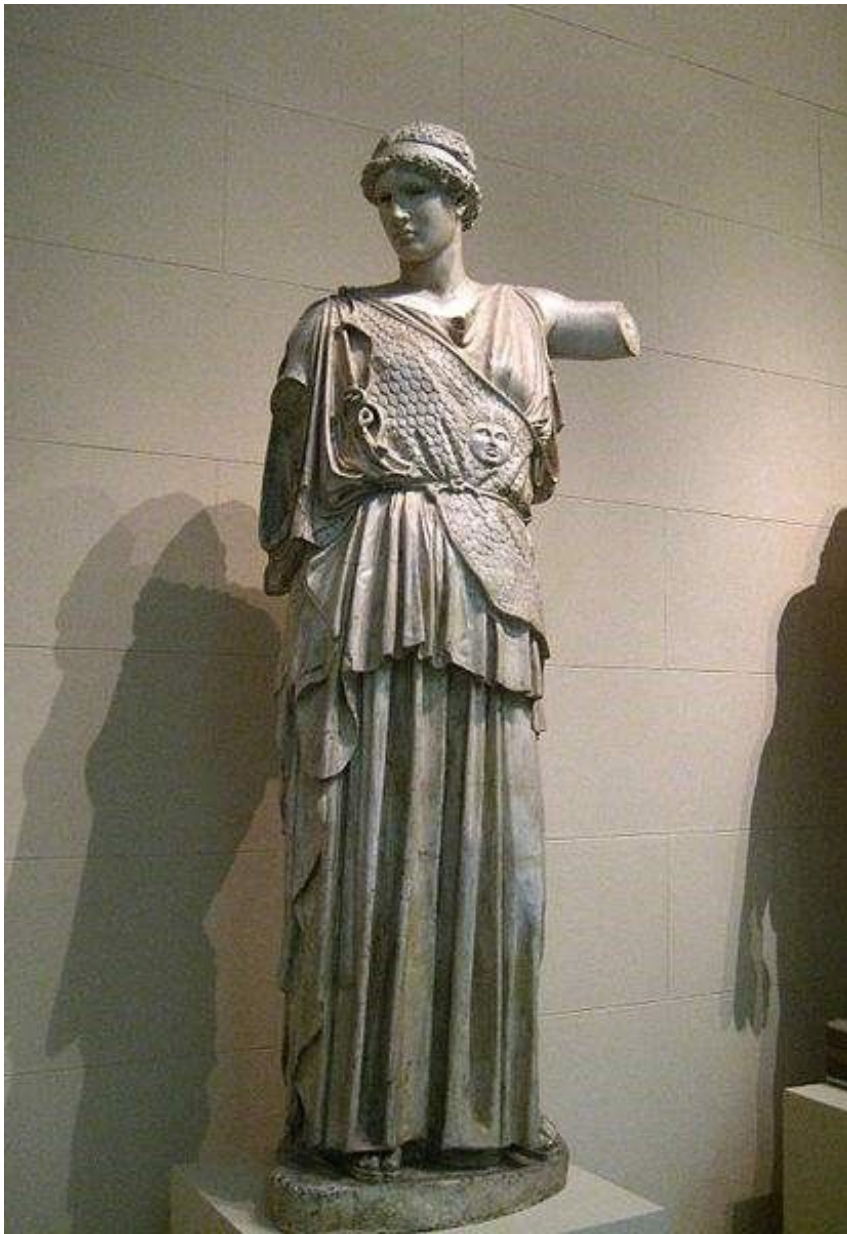
Рис. 12. Диагональная эгида. Афина Лемния. Римская копия бронзовой статуи Фидия. 450—440 гг. до н. э. Германия, Дрезден. Государственный музей Альбертинум

29 Или крестообразной. Здесь она выполняет функцию нагрудного женского пояса: