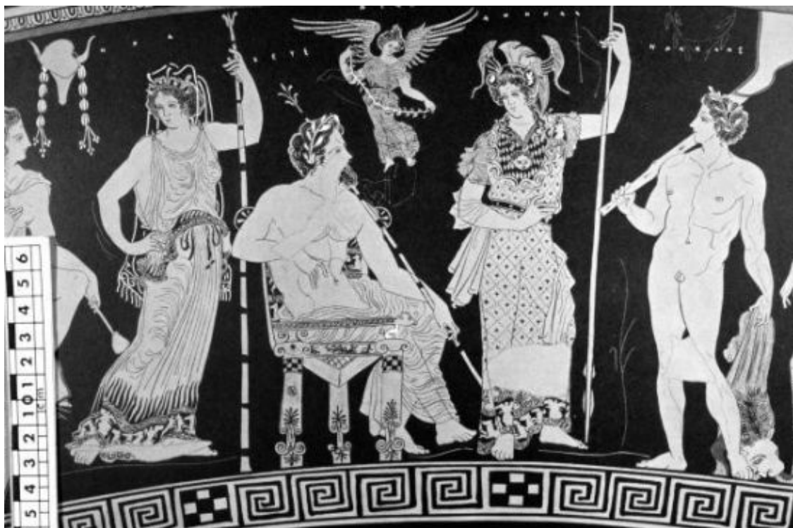
Рис. 9. Вознесение Геракла на Олимп. Аттический краснофигурный кратер из Фалерий. Ок. 400 г. до н. э. Италия, Рим. Национальный музей вилла Джулия

23 Как кокетливый воротничок с кружевными завитками змей: