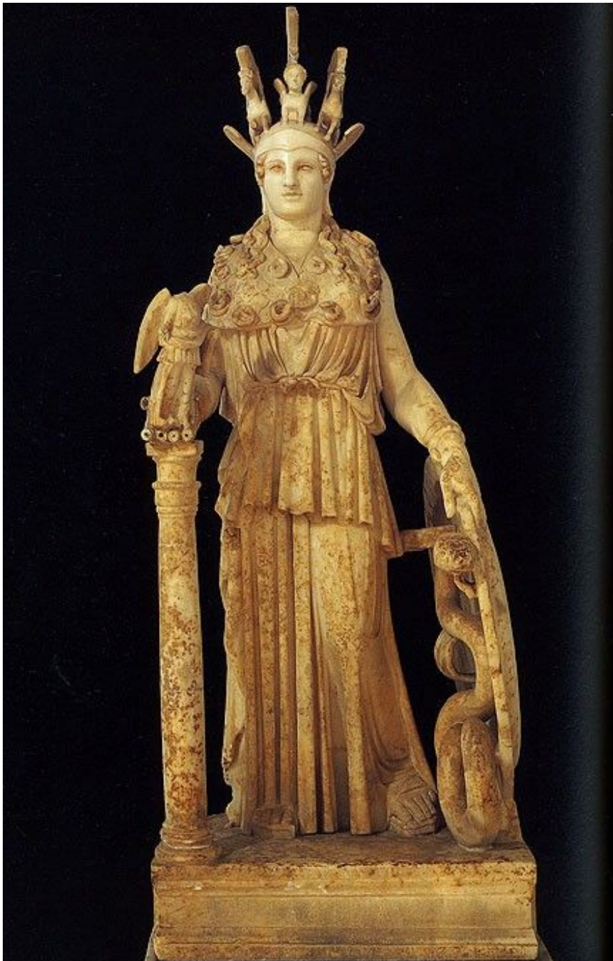
Рис. 8. Афина Варвакион. Римская копия III в. н. э. статуи Афины Партенос Фидия 447—432 гг. до н. э. Мрамор. Греция, Афины. Национальный музей