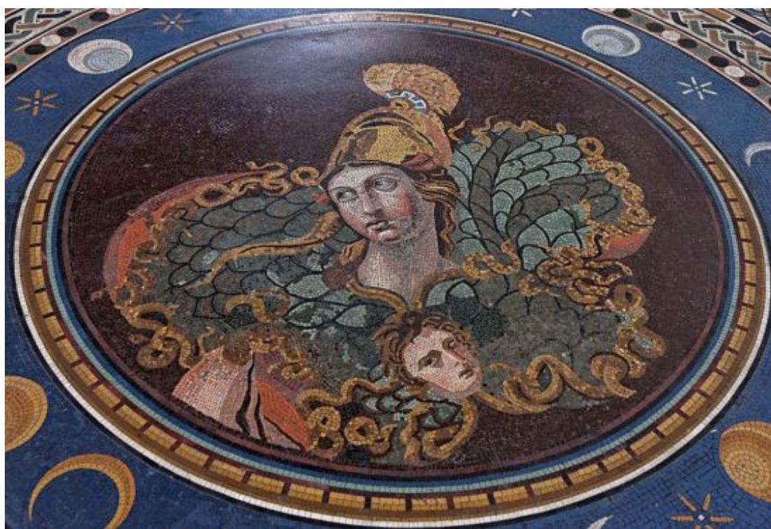
Рис. 7. Афина с эгидой. Римская мозаика III в. н. э., обрамленная мозаикой XVIII в. из Тускула. Ватикан. Музей Пио-Клементино. Зал греческого креста