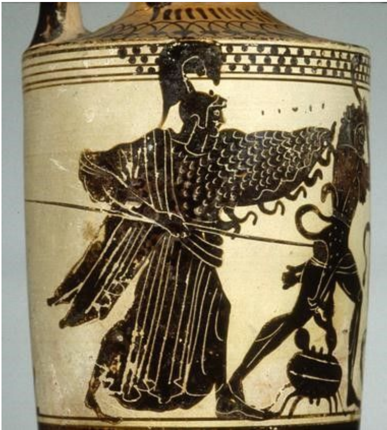
Рис. 2. Афина в эгиде и шлеме с копьем в правой руке, левой рукой помогает Гераклу (сцена: Геракл и Иолай в борьбе с гидрой). Чернофигурный лекиф из Эретрии. Ок. 500—480 гг. до н. э. Франция, Париж. Лувр