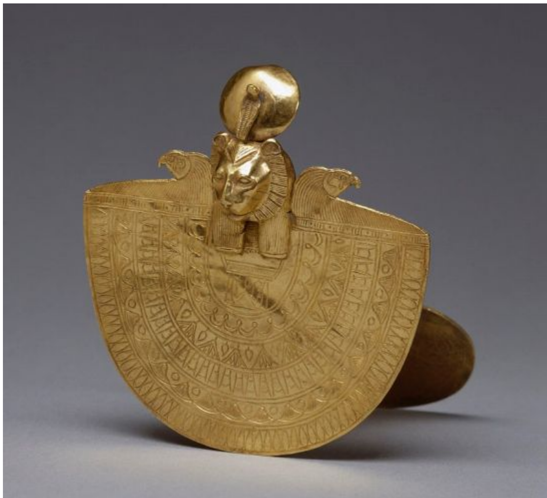
Рис. 16. Так наз. египетская эгида с головой богини войны Сохмет. 900—750 гг. до н. э. Золото. Высота 6,8 см, ширина 6,6 см, глубина 6,8 см. США, Балтимор. Художественный музей Генри Уолтерса.