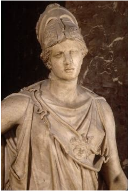
Рис. 11. Афина в шлеме и круговой эгиде. Мраморная римская копия с греческого оригинала классического времени из Пирея (Афины)

27 Эгида может быть диагональной, носимой, как перевязь: