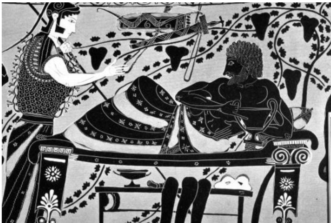
Рис. 4. Афина и пирующий Геракл. Краснофигурная амфора из Вульчи мастеров Андокида и Лисиппида. Ок. 530—510 гг. до н. э. ФРГ, Мюнхен. Музей античного искусства