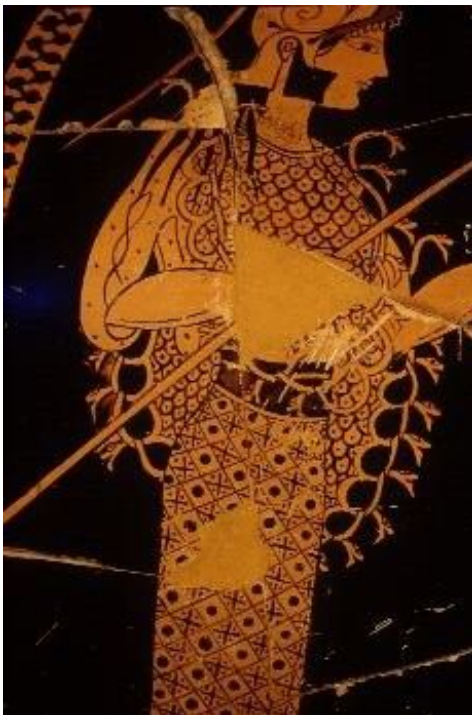
Рис. 3. Афина в эгиде в сцене «Геракл и Цербер». Аттическая краснофигурная амфора из Вульчи мастеров Андокида и Лисиппида. Ок. 520—510 гг. до н. э. Франция, Париж. Лувр