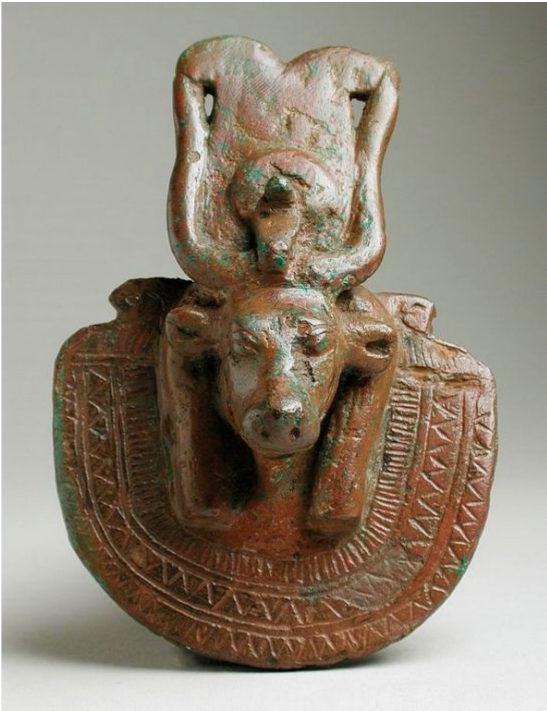
Рис. 17. Коровьеголовая богиня (Исида?) в «эгиде». 332—30 гг. до н. э. Бронза. США. Музей искусств округа Лос-Анджелес