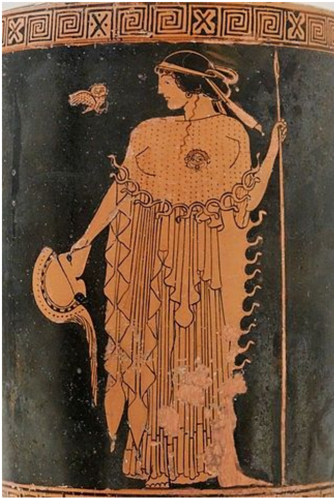
Рис. 1. Афина в эгиде, с копьем, шлемом и совой. Аттический краснофигурный лекиф. 490—480 гг. до н. э. США, Нью-Йорк. Метрополитен-музей. Отдел греческого и римского искусства