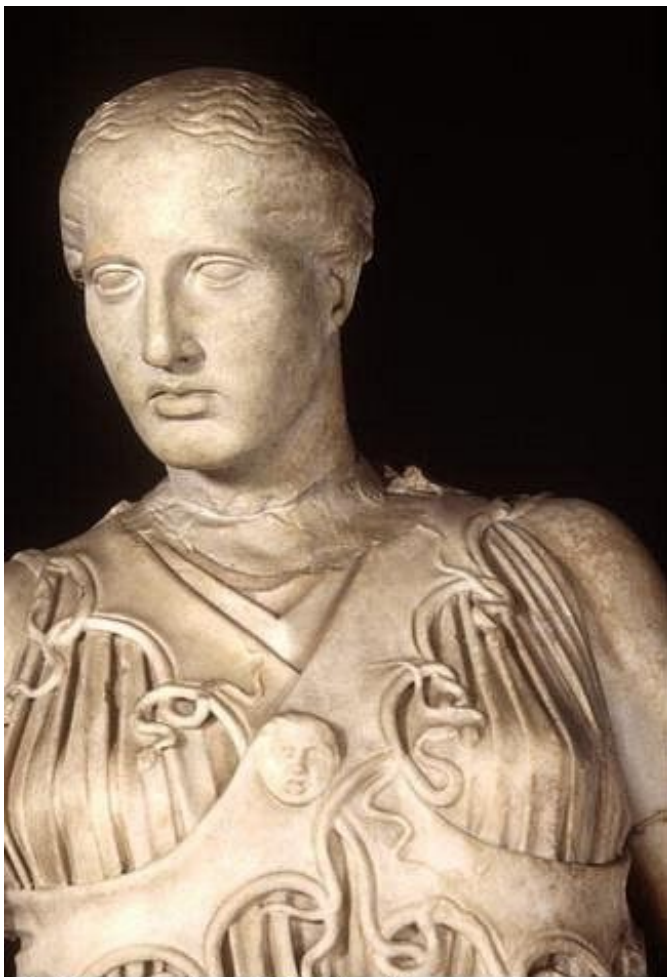
Antikensammlung SMPK Berlin

Рис. 13. Афина в крестообразной эгиде. Мраморная статуя из Пергама. Ок. 150 г. до н. э. ФРГ, Берлин. Музей античности