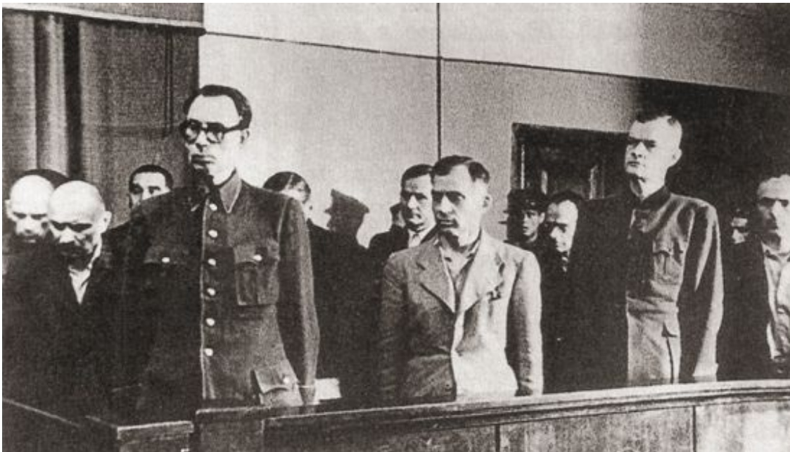
Суд над Власовым и его приспешниками. Москва. Июль 1946 г.