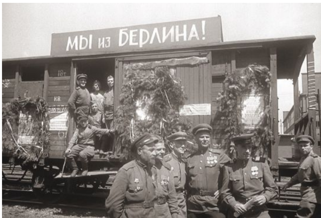
Эшелон «Мы из Берлина» с советскими военнослужащими. 1945 г.

13 Оккупанты полностью или частично разрушили и сожгли 1710 городов и поселков, свыше 70 тыс. сел и деревень, вывели из строя более 60 тыс. км железнодорожных путей и 1870 мостов. Враги уничтожили свыше 6 млн зданий, 25 млн человек лишились крова, и многие были вынуждены жить в землянках. В РСФСР, где оккупации подверглись полностью или частично 23 области, края и автономные республики, такие города, как Сталинград, Севастополь, Новороссийск, Керчь, Ржев были превращены в