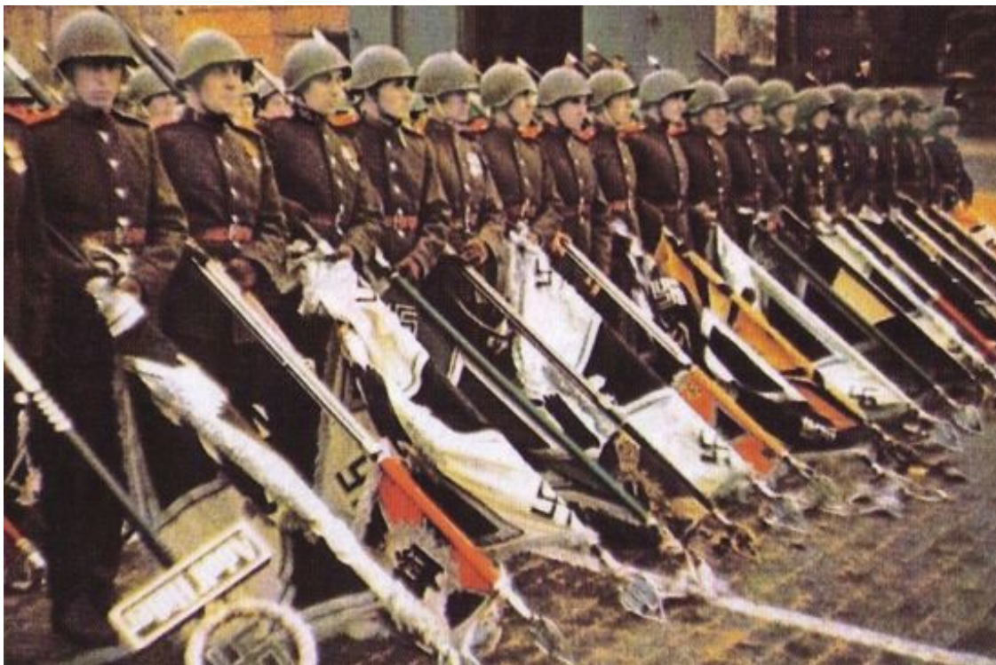
Поверженные знамена гитлеровских частей. Парад Победы 24 июня 1945 г. Красная площадь