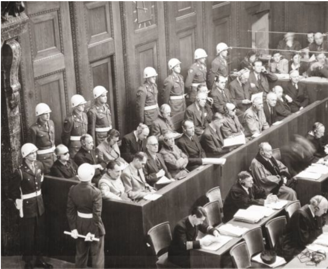
Скамья подсудимых в зале Нюрнбергского трибунала