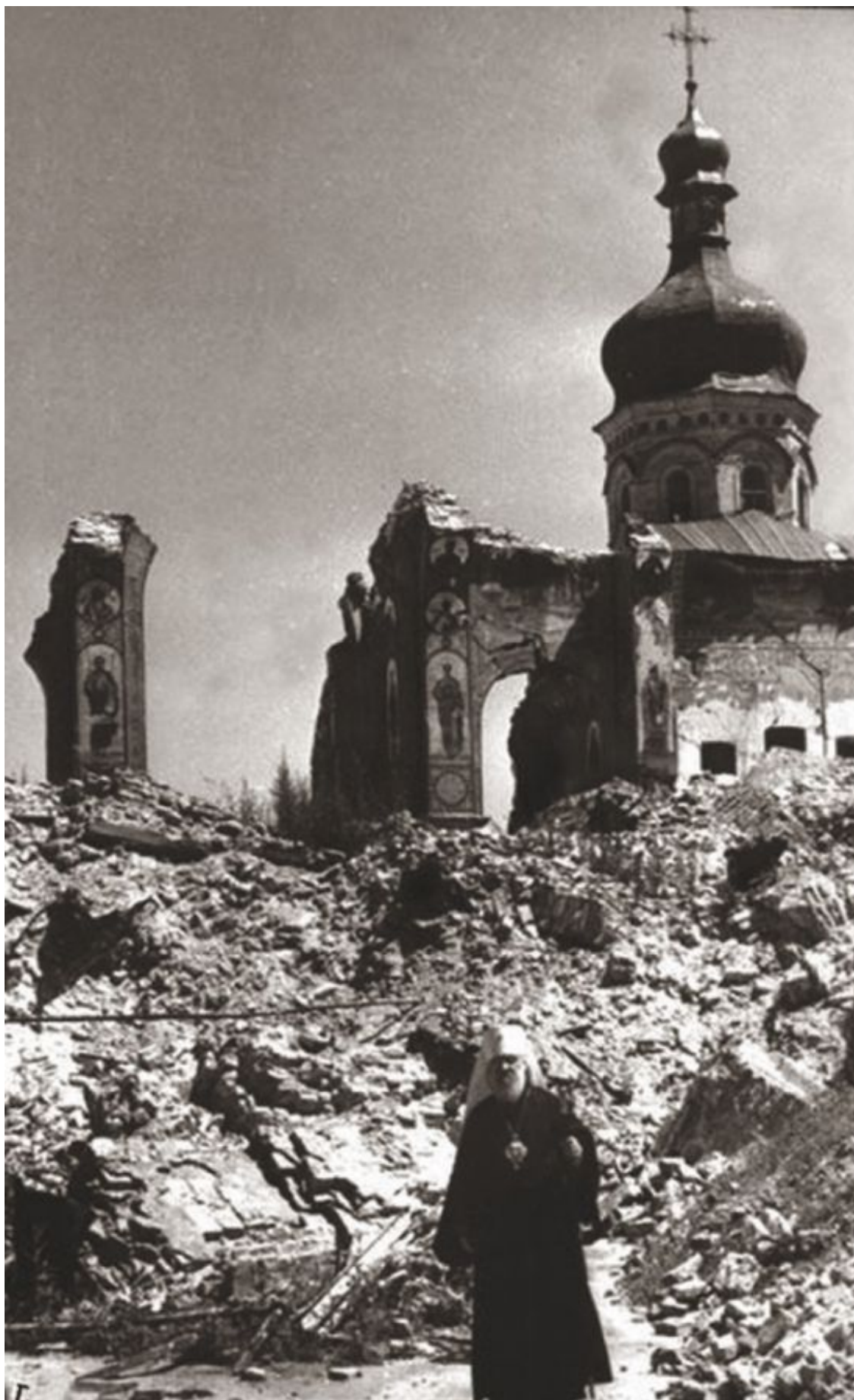
Священник рядом со взорванным Успенским собором Киево-Печерской лавры. Ноябрь 1941 г.