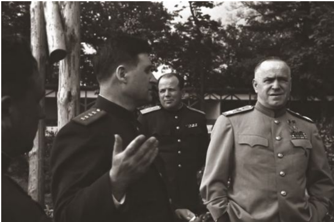
Советская делегация перед подписанием Акта о безоговорочной капитуляции всех вооруженных сил Германии. 8 мая 1945 г.