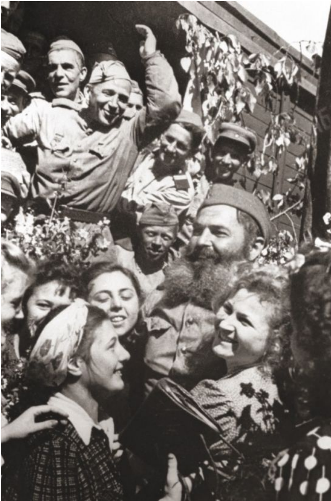
Москва, Белорусский вокзал. Встреча советских воинов-победителей. 1945 г.